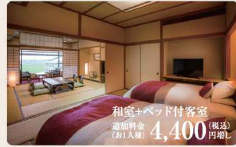
和室+ベッド付客室 追加料金(お1人様) 4,400 (税込) 円増し