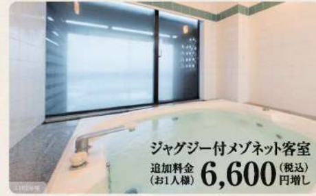
ジャグジー付メゾネット客室 追加料金(お1人様) 6,600 (税込) 円増し