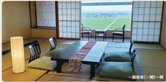
一般客室(二間)一例