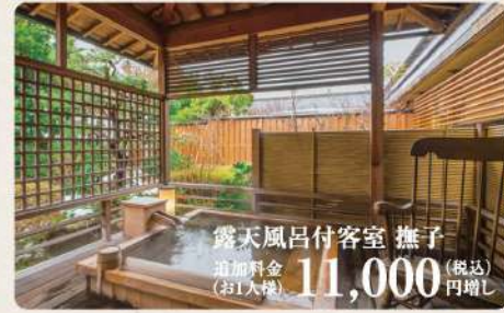
露天風呂付客室 様子 追加料金(お1人様) 11,000 (税込) 円増し