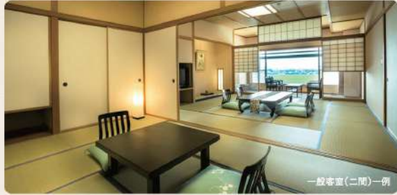
一般客室(一間)一例